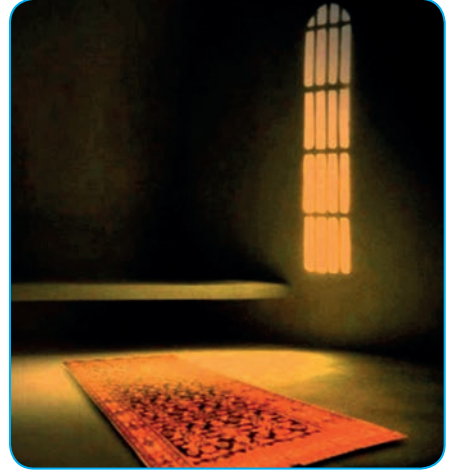
Görsel 3. 7. İtikaf, meşguliyetlerden uzaklaşarak kişinin kendini Rabbine adanmasıdır.

İtikâfa giren kimsenin gücü yettiği kadar namaz kılması, Kur'an okuması, istiğfar etmesi, dua ve niyazda bulunması; Allah'ın (c.c.) varlığı, birliği ve kudreti hakkında tefekkür etmesi, gereksiz şeyler konuşmaması ve İslam'a dair kitaplar okuyarak vaktini değerlendirmesi gerekir.