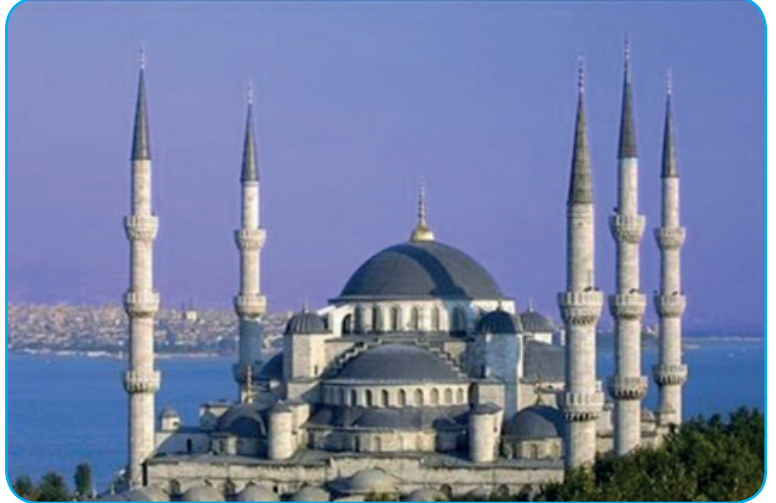
Görsel 3. 13.

İnfak yol, su, hastane, kütüphane, okul, cami gibi hayırlı hizmetleri içine alan çok geniş kapsamlı bir ibadettir.