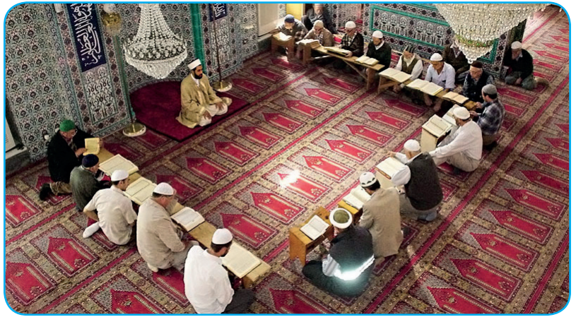
Görsel 3. 6. Mukabele, hem Ramazan ayını değerlendirmek hem de Hz. Peygamber'in (s.a.v.) bir uygulamasını yaşatmak için uygulanan çok değerli bir ibadettir.

Mukabele: Ramazan ayında bir kişinin Kur'an-ı Kerim'i sesli okuması, diğerlerinin ise takip etmesi şeklinde Kur'an-ı Kerim'in baştan sona okunmasıdır. Genellikle her gün bir cüz (20 sayfa) okunarak bir ay içinde Kur'an-ı Kerim hatmedilir.