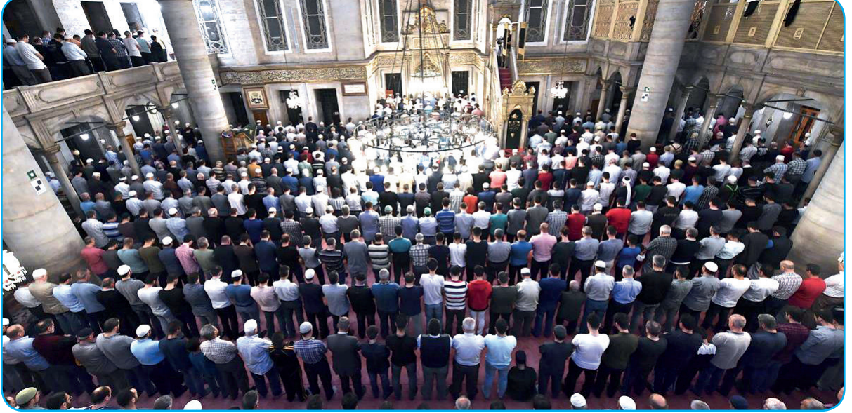
Görsel 3. 5. Ramazan gecelerinde Müslümanlar bu ayı teravih namazı ile ihyâ ederler.

Teravih namazı camide veya evde, cemaatle veya tek başına kılınabilir. Önemli olan Ramazan ayını fırsat bilip en iyi şekilde değerlendirmek, bu ayın bereketi ile Allah'ın (c.c.) rızasına ulaşabilmektir. Peygamberimizin (s.a.v.) şu hadisi, teravih namazının Müslümanlar için önemini çok güzel bir şekilde açıklar: “Ramazan ayını, inanarak ve sevabını Allah'tan bekleyerek ihya eden kimsenin geçmiş günahları bağışlanır.” 13