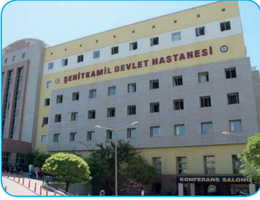
Görsel 3. 10.