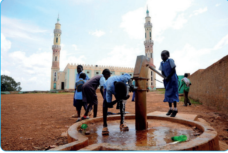
Görsel 3. 14. İslam dini, infak kültürü ile dünyanın her yerindeki ihtiyaç sahibi Müslümanlar'a ulaşmayı hedefler.

çıkarmayın... 45 buyurmuştur. Bu ayet bize gösteriş yapmadan, incitmeden iyilik yapmanın sadaka olarak değerlendirileceğini ve Allah (c.c.) rızasını kazandıracığını haber vermektedir.