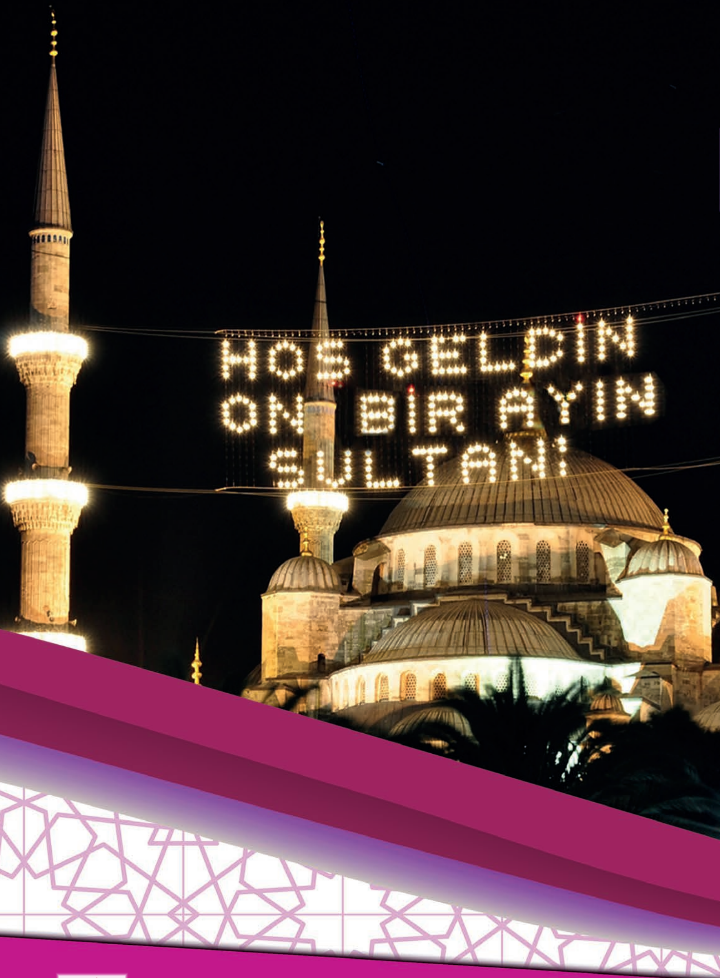
Görsel 3. 1.