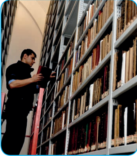
Görsel 3. 12.