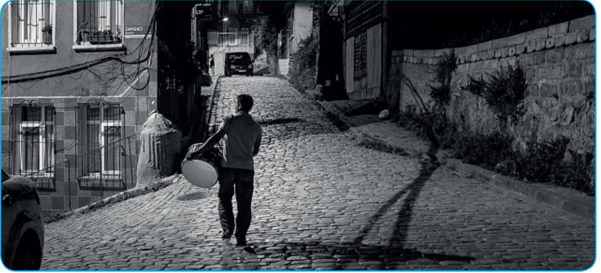
Görsel 3. 3. Sahur vakti davulcuların insanları sahura kaldırması gelenek halini almıştır.