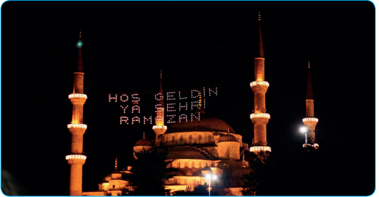
Görsel 3. 2. Ramazan ayı, birçok camide mahyalarla karşılanır.