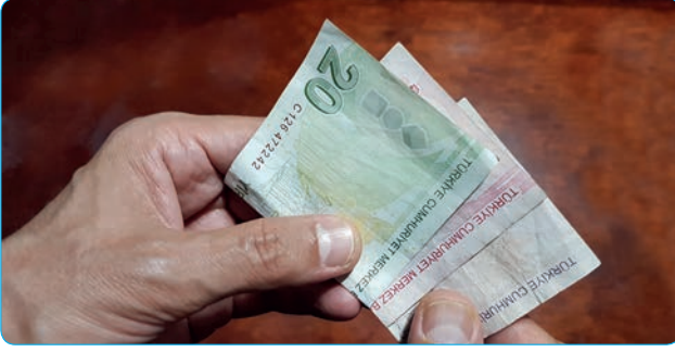
Görsel 3. 8. Fitre, Ramazan ayına özgü bir sadakadır.

Oruç ibadeti farz, vacip ve nafil olmak üzere üç çeşittir.