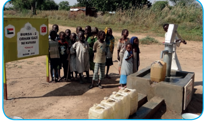
Görsel 3. 11.