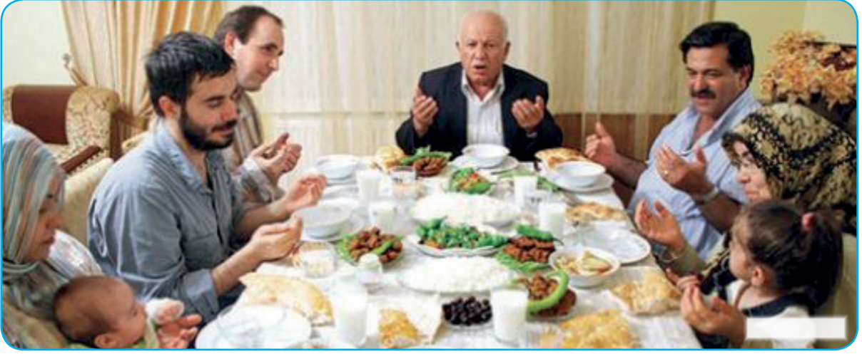
Görsel 3. 4. İftar vaktinde tüm aile fertleri bir araya gelerek dualar eşliğinde oruçlarını açarlar.