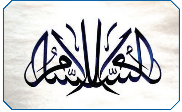
Görsel 33: Es-Salam hattı

Arapça bir kelime olan ahlak, hulk ve hulûk kelimelerinin çoğuludur. Huy, yaratılıştan gelen özellikler, yapı, mizaç, karakter, kişilik ve alışkanlık gibi anlamlara gelir. Kavram olarak ise insanın iyi veya kötü olarak vasıflandırılmasına yol açan manevi nitelikler, huylar ve bunların etkisiyle ortaya koyduğu iradeli davranışlar bütünüdür.