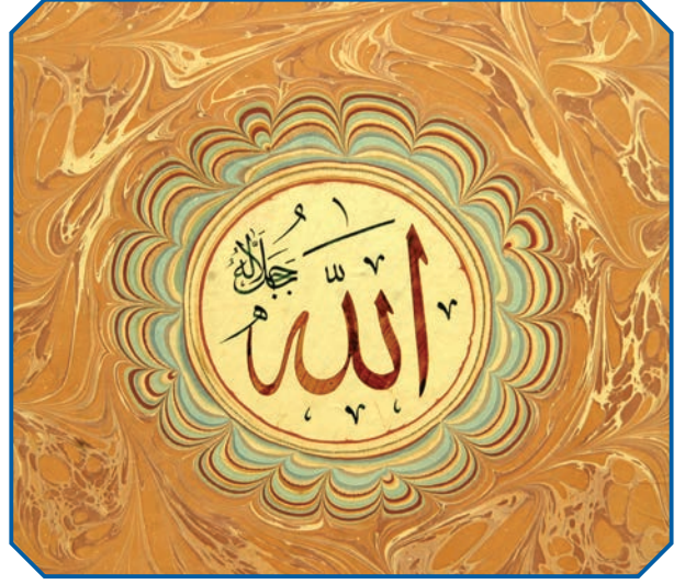
Görsel 38: Lafzatullah (Hattat: Arif VURAL)

Kainatı yoktan var eden Yüce Allah'ın, varlığı için hiçbir şeye ihtiyacı yoktur. Kâinattaki her şey O'nun yaratmasıyla var olmuştur. O'nun dışındaki her şey var olabilmek ve varlığını sürdürebilmek için her an Allah'a (c.c.) muhtaçtır. 27 Rabb'imiz Allah (c.c.) birdir; eşi, benzeri, ortağı yoktur. "Tek Allah (c.c.) inancı" demek olan "tevhit inancı" dinimizin temelidir. Tevhidin zıddı olan şirk ise; Allah'tan (c.c.) başka varlıklara ilahi özellikler atfetmek, onları rab ve ilah kabul etmek demektir. Allah'a (c.c.) şirk koşmak, dinimizde en büyük günah olarak nitelenir. Kendisini bize tanıttığı şekliyle O'nun varlığına iman etmek asli vazifemizdir.