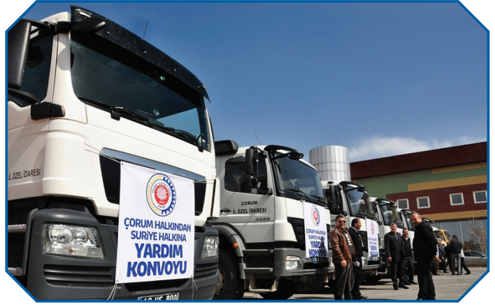
Görsel 44: Darda kalanlara yardım etmek insani vazifemizdir.

İslam dininde beşeri ilişkilere ve bu ilişkilerin temelini oluşturan ahlaki özelliklere çok önem verilmiştir. Örneğin “Şüphesiz Allah, adaleti, iyilik yapmayı, yakınlara yardım etmeyi emreder; hayasızlığı, fenalık ve azgınlığı da yasaklar. O, düşünüp tutasınız diye size öğüt veriyor.” 67 ayetinde adalet, ihsan, yakınları gözetmek gibi iyilikler emredilirken; her türlü çirkin iş, fenalık ve azgınlık yasaklanmıştır. Peygamber Efendimiz bir hadisinde Müslümanı, “Dilinden ve elinden (gelecek kötülükler konusunda) Müslümanların güven içinde oldukları kimse!” 68 diyerek tarif etmiştir. Bir diğer hadisinde ise “Sizden biriniz kendisi için istediğini Müslüman kardeşleri için de istemedikçe gerçek manada mü’min olamaz.” 69 buyurarak insanlar arasındaki ilişkileri her yönüyle kuşatan ve bütün ahlaki davranışların özünü teşkil eden bir ilkeye dikkat çekmiştir. Karşılıklı vazifelerimiz arasında selamlaşmak, davete icabet etmek, zor zamanlarında yardımlaşmak, hastaları ziyaret etmek, cenazelere katılmak da vardır. Bu konuda Peygamber Efendimiz şöyle buyurmaktadır: “Müslümanın Müslüman üzerinde altı hakkı vardır. Karşılaştığında selam verir, davetine icabet eder, aksırdığı zaman elhamdülillah derse yerhamükallah der, hastalandığında ziyaretini yapar, öldüğünde cenazesinin ardından yürür, kendisi için sevdiğini o kardeşi için de sever.” 70