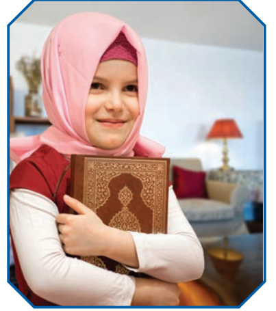
Görsel 37: Kur’an bizi terbiye eder.

Eğitimin amaçlarından biri de ahlaklı bireyler yetiştirmektir. Bu açıdan bakıldığında insanları eğitmek ve terbiye etmek Kur’an-ı Kerim’in de temel amaçlarından biridir. Yüce kitabımızın açıklayıcısı ve insanlara en güzel örnek olan Hz. Muhammed (s.a.v.), terbiye konusunda da bize en güzel örnektir. Nitekim Peygamber Efendimiz “Beni Rabb’im terbiye etti ve ne güzel terbiye etti.” 19 sözüyle terbiyenin asıl kaynağının Yüce Allah olduğunu vurgulamıştır.