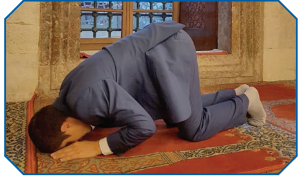
Görsel 39: "Ey iman edenler! Rükû edin, secde edin, Rabbinize kulluk edin ve hayır işleyin ki kurtuluşa eresiniz." (Hac suresi, 77. ayet.)