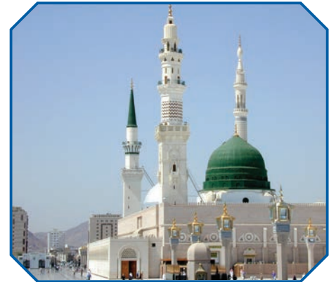
Görsel 41: Peygamber Efendimizin Medine'de bulunan kabri ve mescidi.

Peygamber Efendimize sevgimizin bir göstergesi de ona salat ve selam getirmektir. Salat; dua, rahmet ve mağfi-ret anlamına gelir. Selam ise esenlik ve barış anlamındadır. Bu iki kelimeden oluşan salat ü selam, dilimizde salavat getirme tabiriyle ifade edilir. En yaygın olarak bilinen salavat, sallallahu aleyhi ve sellem şeklindedir. Peygamber Efendimize salavat getirmek, ona olan bağlılığımızı teyit etmek, ona karşı sevgimizi ve hürmetimizi ifade etmek demektir. Kur'an-ı Kerim'de şöyle buyrulur: “Şüphesiz Allah ve melekleri Peygamber'e salât ediyorlar. Ey iman edenler! Siz de ona salât edin, selam edin.” 51 Müslümanlar olarak namazdaki oturuşlarda sallı barik dualarını okuyarak ve Pey-