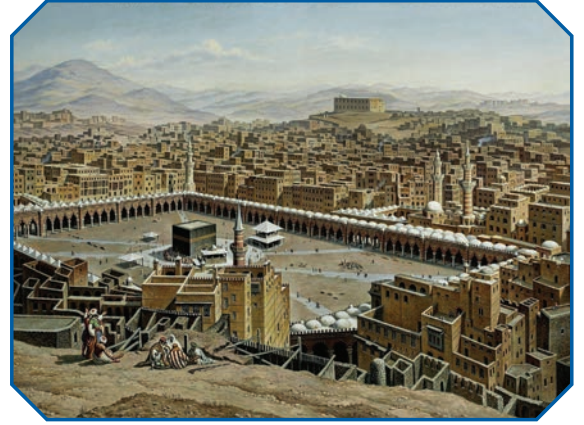
Görsel 40: Peygamber Efendimizin doğup büyüdüğü Mekke’den geçmekte kalan bir görünüm.

Müslümanlar olarak peygamberlik öncesinde bile içinde yaşadığı toplum tarafından Muhammedü’l-Emin olarak bilinen Peygamber Efendimizi, Allah’ın (c.c.) son elçisi olarak kabul ederiz. Onun sadık ve güvenilir bir resul olduğunu tasdik eder, Allah’tan (c.c.) getirdiği vahye iman ederiz. Bu yönüyle Peygamberimize karşı vazifelerimizin ilkinin Hz. Muhammed’i (s.a.v.) Allah’ın (c.c.) peygamberi olarak tanımak ve haber verdiği konuların tamamını tasdik ederek yaşamak olduğunu biliriz.