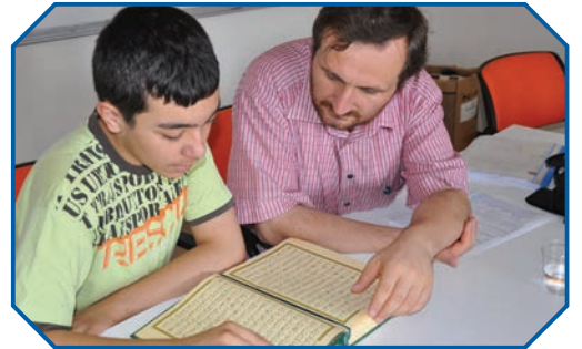
Görsel 42: "Sizin en hayırlınız, Kur'an'ı öğrenen ve öğretenidir." (Tirmizî, Fedâilü'l-Kur'an, 15.)

Kur'an-ı Kerim'i hürmetle ve muhabbetle okumamız da bir mü'min olarak vazifelerimizdendir. Ona olan saygımız ve sevgimiz hem dünyada hem ahirette bir nur olarak bizi kuşatır. Onu abdestli okumak Allah'ın (c.c.) kitabına saygının bir gereğidir. Peygamber Efendimiz Kur'an okumak için bir araya gelenlerle ilgili şöyle bir müjde vermektedir: "...İnsanlardan bir grup, Allah'ın evlerinden bir evde toplanırlar. Allah'ın kitabını (Kur'an'ı) okurlar ve onu aralarında konuşarak mânâsını anlamaya çalışırlarsa, üzerlerine sukûnet (huzûr ve gönül rahatlığı) iner, onları rahmet kaplar ve melekler onların etrafını kuşatır..." 60