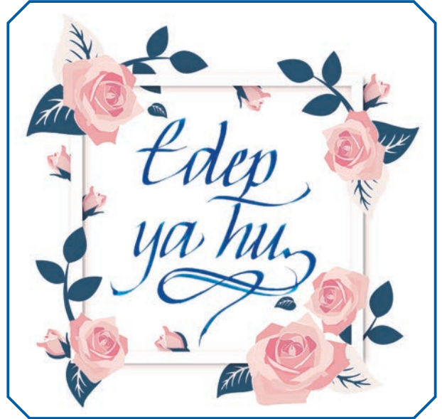
Görsel 34: Edepli olmak İslam ahlakının bir gereğidir.

“Ey Allah’ım! Kalbimi İslam üzerine sabit kıl. Ben, Rab olarak sana, din olarak İslam’a razı oldum...” (Tirmizî, Deavât, 89.)