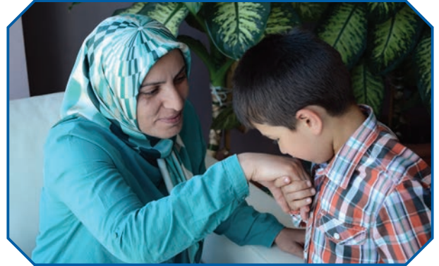
Görsel 43: Dinimiz büyüklerimize saygı, küçüklerimize sevgi göstermeyi emreder.

Dinimizin ahlaki prensipleri, toplumsal yapıyı karşılıklı sevgi ve saygı esaslarına göre kurmaya, haklara riayet etmeye, bireysel ve toplumsal sorumlulukları yerine getirmeye yöneliktir. Bu yönüyle dinimizde herkes bir arada yaşamının gerektirdiği vazifeleri yerine getirmekle mükelleftir. İnsanlara karşı sorumluluklarımız arasında birbirimizi sevmek ve karşılıklı haklarımıza saygı göstermek de vardır. Toplumun diğer üyeleriyle uyumlu bir şekilde yaşayabilmek için karşılıklı sevgi ve saygı gerekir. Bu konuda Peygamber Efendimiz “Büyüklerimize saygı göstermeyen ve küçüklerimize merhamet duymayan bizden değildir.” 66 buyurarak toplumsal yapımızın saygı ve sevgi temelli olması gerektiğini vurgulamıştır. Çalışmak, üretmek, yakınlarımıza ve topluma yük olmamak, kamuya ait malları, okulları, hastaneleri, ormanları ve çevreyi korumak da toplumsal görevlerimizdendir.