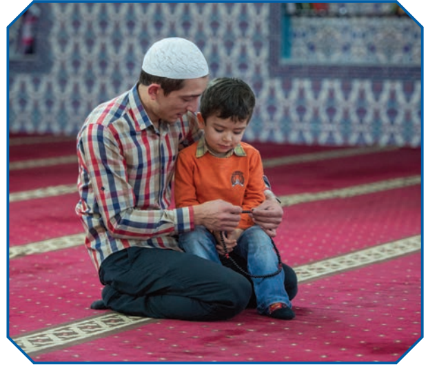
Görsel 35: İslam ahlakı bize “Neyi, nasıl yapmalıyız? sorularının cevabını verir.

Sonuç olarak ahlak, ancak Allah'ın (c.c.) emirleri doğrultusunda yönlendirildiği takdirde güzel ahlak olur. Ahlaki olarak iyi olan şeyler Allah'ın (c.c.) emrettikleri, kötü olan şeyler ise Allah'ın (c.c.) yasakladıklarıdır.