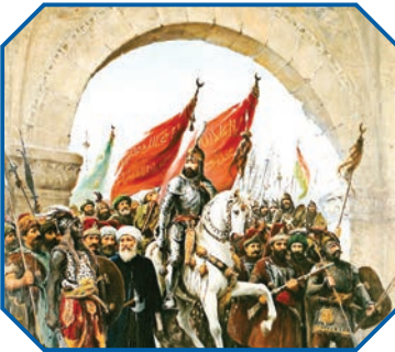
Fatih'in İstanbul'a girişi (Temsilî)

Aziz milletimizin İslam ile müşerref olduktan sonraki yegâne amacı "İlâ-yı Kelimetullah" yani "Allah (c.c.) isminin yüceltilmesi" olmuştur. Atalarımız bu gayeyle fetihler yapmışlar ve İslam dininin yayılmasına gayret etmişlerdir. Dinî ve millî değerlerin yüceltilmesi üzerine bir medeniyet kurmuşlar ve bunu Allah'a (c.c.) karşı bir vazife olarak görmüşlerdir.