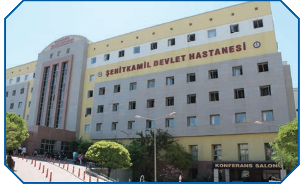
Görsel 32: Kamu yararını tesis için büyük yatırımlar yapılır.

Bireysel hakları kullanırken ve sorumlulukları yerine getirirken kamu yararı gözetilmelidir. Bireysel menfaat ile kamu menfaati çatıştığında, kişilerden kamu yararına göre hareket etmesi beklenir. Ancak bunu yaparken bireysel haklar da gözetilmelidir. Örneğin bir yerleşim yerinde ihtiyaç duyulan yol, hastane ve okul gibi bir kamu hizmetinin gerçekleştirilebilmesi için gerekli olan arazi özel mülkiyetse, bedelinin kişiye devlet tarafından ödenmesi suretiyle kamulaştırılması gerekir. Böylece bireysel haklar da korunarak kamu yararı gözetilmiş olur.