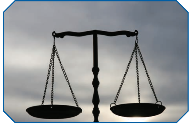
Görsel 31: İslam hukukuna göre suç ve ceza arasında denge olması gerekir.

Suçun niteliğini belirleyen bazı unsurlar vardır. Örneğin suç işleyen kişinin çocuk olması ile yetişkin olması; ruhsal sağlığının yerinde olması ile akli dengesinin bozuk olması gibi durumlar suçun karşılığı olan cezanın niteliğini değiştirir. Suç kabul edilen fiilin bir saldırı olması ile bir müdafanın gereği olması da yine suçun niteliğini belirleyen unsurlardandır. Suçtan doğan zararın boyutu da suç hakkında hüküm verirken önemlidir. Zararın boyutu, telafi edilebilirliği, bireysel veya kamusal boyutu suçun niteliğini etkiler. Örneğin bir suç, kamusal boyutta bir zarara yol açmışsa cezası daha fazla olur. Yine suçu işleyen kişinin niyeti de suçun niteliğini belirlemek açısından göz önünde bulundurulması gereken hususlardandır. Kişinin, suçu kasıtlı olarak işlemesi ile dikkatsizlik veya kontrolsüzlük sonucu gerçekleştirilmesi, belirleyecek cezayı da değiştirecektir.