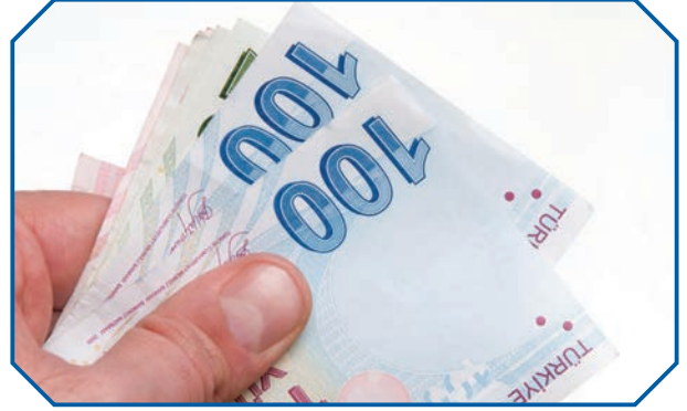
Görsel 23: Rüşvet, haksız menfaat elde etmektir.

Kur'an-ı Kerim'de “ Aranızda mallarınızı haksızlıkla yemeyin; bildiğiniz halde günaha girerek insanların mallarından bir kısmını yemek için onu (rüşvet olarak) hâkimlere vermeyin. ” 47 buyrulurak rüşvet kesin bir biçimde yasaklanmıştır. Peygamberimiz de “ Allah'ın laneti, rüşvet verenin ve rüşvet alanın üzerinedir. ” 48 buyurarak rüşvetin ne kadar büyük bir günah olduğunu bizlere açıklamıştır. Yine Peygamberimiz tarafından vergi memuru olarak görevlendirilen Abdullah b. Revâha, vergiyi az alması için rüşvet teklif edenlere “teklif ettiğiniz şey rüşvettir biz onu yemeyiz” 49 diyerek reddetmesi bir Müslümanın rüşvet karşısında göstermesi gereken tavrı bizlere öğretmiştir.