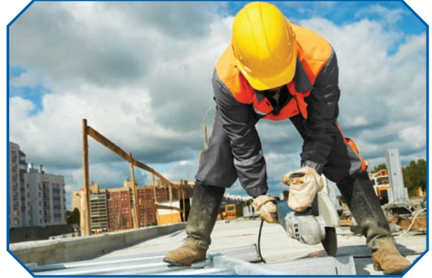
Görsel 21: İşçi ve işveren, iş güvenliğiyle ilgili önlemleri dikkate almalıdır.

Sonuç olarak, işçinin ve işverenin birbirlerine karşı gözetmeleri gereken hakları ve sorumlulukları vardır. Bunlar gözetilmediğinde hukuki, ahlaki ve uhrevi sonuçlar ortaya çıkar. Peygamberimizin şu hadisi sadece işçi işveren ilişkilerini değil, bütün insani ilişkileri de düzenleyen temel bir ilkedir. “Sizden biriniz kendisi için sevip istediğini, kardeşi için de istemedikçe iman etmiş sayılmaz.” 29