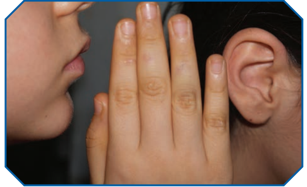
Görsel 18: Dedikodu en büyük kul haklarından birisidir.

Kul hakkı ihlali gündelik hayatta bazı tutum ve davranışlarda da karşımıza çıkar. Örneğin trafikte kırmızı ışıkta geçmek, aracını yanlış yere park etmek, sıraya girilmesi gerekirken diğer insanların önüne geçmek gibi davranışlar hak ihlalidir ve kul hakkına girmektir. İnsanların mahremiyet sınırlarına izinsiz girmek; özel hayatlarını araştırmak, istemedikleri şekilde hitap etmek; alaya almak, emek vererek ürettikleri kitap, makale, program, yazılım vb. telif hakkı olan ürünleri izinsiz bir şekilde kullanmak; başkasının ürettiğini kopyalayarak haksız kazanç sağlamak gibi davranışlar da kul hakkının ihlal edilmesi demektir.