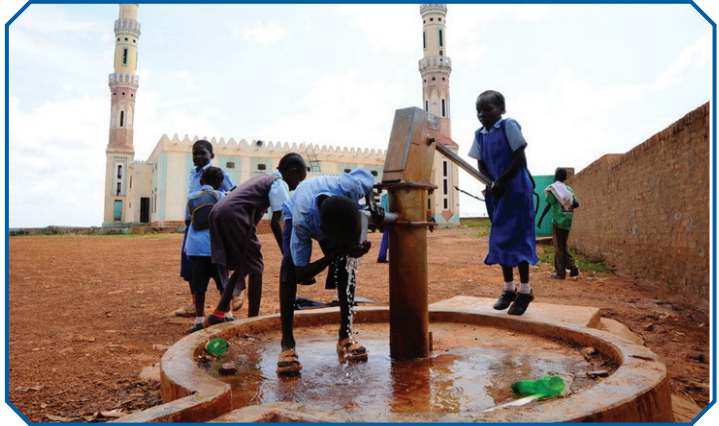
Görsel 15: İhtiyacı olanlara su kuyusu yaptırmak da infaktır.

İnfak kültürü; zekât, sadaka, fidye, fitre gibi maddi yardımlar, düşenin elinden tutma, danışana yol gösterme, ilim öğretme, ustalık-çıraklık ilişkisi içinde meslek öğretme gibi manevi yardım-