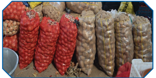
Görsel 26: İnsanların ihtiyacı olan ürünleri daha çok kazanma hırsıyla stoklamak karaborsacılıktır.

Karaborsa sözlükte; kısığa sebep olmak, tedavülden çekmek, istiflemek, tekeline almak anlamına gelir. Terim olarak insanların ihtiyacı olan ticaret mallarını toplayıp stoklayarak pahalılaşmasını beklemek ve bu gayeyle piyasaya sürülmesini geciktirmektir. Karaborsacılıkta amaç, piyasada meydana gelen darlık ve fiyat yükselmesi neticesinde stoklanan malı piyasaya sürmek ve yüksek kâr elde etmektir. Karaborsacılığa İslami kaynaklarda ihlikâr denir. 58