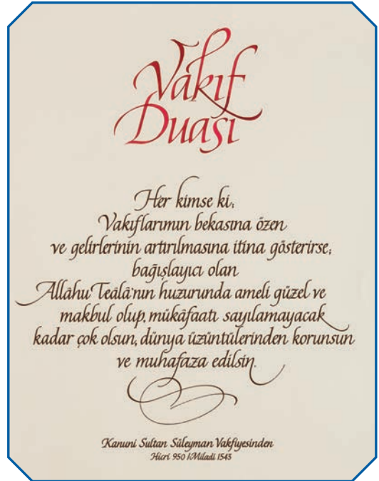
Görsel 16 Kanuni Sultan Süleyman'ın vakıflara gerekli özeni gösteren kişilere ettiği dua.