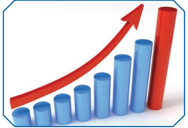
Görsel 25: Fiyatları yapay olarak yükseltip menfaat elde etmek İslam’a göre haksız kazanç sayılır.

Fiyat-değer ilişkisini bozarak yapay fiyat yükseltme yollarından biri de manipülasyondur. Manipülasyon; oyun, entrika, hile, dalavere, hokkabazlık, piyasada yalan yanlış haberlerle faaliyette bulunarak piyasayı kendi çıkarları doğrultusunda yönlendirme şeklinde tanımlanır. Piyasada yüksek kazanç elde etmek amacıyla menkul kıymetlerin piyasa fiyatlarının yapay olarak yükseltilmesi, düşürülmesi veya belirli seviyede tutulmasına yönelik faaliyetlerin tamamı manipülasyon kapsamında değerlendirilir. Manipülasyona başvurarak pek çok girişimcinin zarar etmesi pahasına yapay olarak fiyatları yükselterek ya da düşürerek kazanç elde etmek kanunen de suçtur. 56